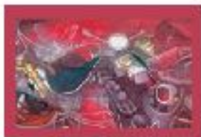
MUSEO THYSSEN- BORNEMISZA