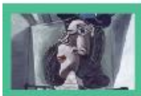
MUSEO NACIONAL DEL PRADO