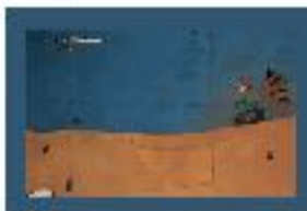
MUSEO NACIONAL CENTRO DE ARTE REINA SOFIA

Le billet 'PASEO DEL ARTE' permet de visiter le fameux 'Triangle de l'Art' de Madrid, formé par les 3 plus importants musées de la ville qui sont très proches et situés sur le Paseo del Prado dans le centre-ville. Le billet (valable pendant 1 an) permet l'accès à la collection permanente du musée THYSSEN-Bornemisza (pas aux expositions temporaires) ; l'accès à la collection permanente ainsi qu'à certaines expositions temporaires du musée du PRADO ; l'accès à la collection permanente et à certaines expositions permanentes du Musée REINA SOFIA .